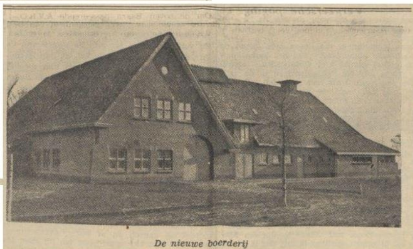
De nieuwe boerderij